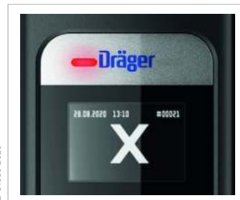
Символ «Алкоголь не обнаружен»