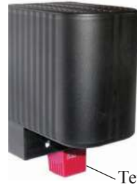
Термостат FTO 011

* Саморегуляция температуры за счет резкого увеличения сопротивления при достижении максимальной температуры (+86...+145°C в зависимости от мощности). Эта функция не заменяет применение термостата.