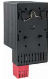
Вид сзади. Монтаж на DIN-рейку