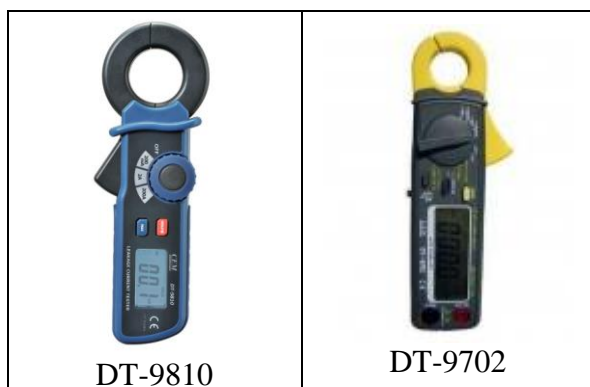
Рисунок 1. Фотографии общего вида клещей серии DT