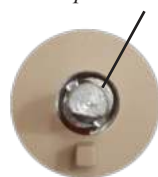
Рис. 2 – Настроечная шайба