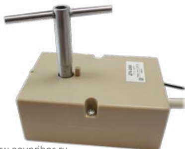
Рис. 3 – Термостат ДТК-2000 с настроечным ключом