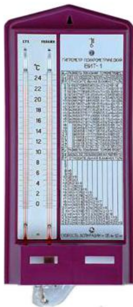
Рисунок 1 - Общий вид гигрометров психрометрических ВИТ-1

Общий вид средства измерений представлен на рисунках 1 и 2.